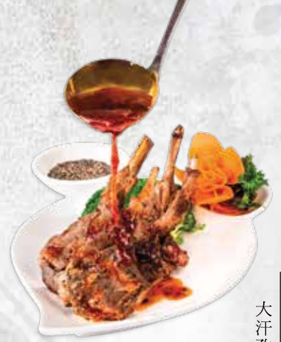
大汗孜然羊扒 四件